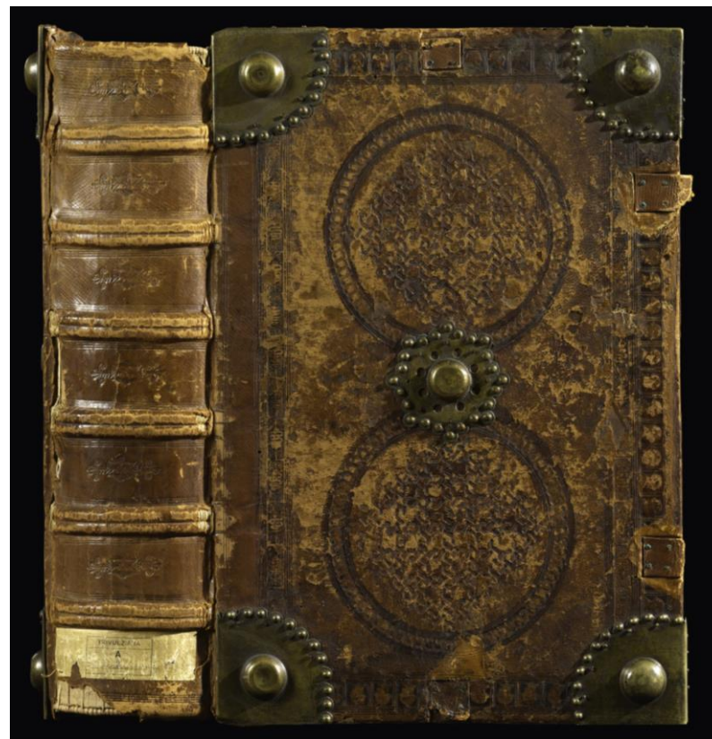
Milano, Archivio Storico Civico e Biblioteca Trivulziana, Cod. Triv. 873 (piatto anteriore e dorso)

Stato di conservazione: discreto. Fiore del cuoio parzialmente scomparso. Cerniere molto indebolite. Volume restaurato.